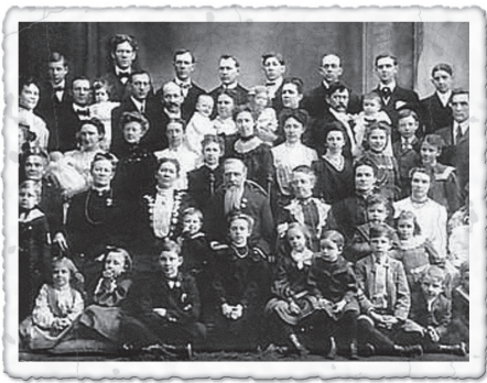
Joseph Smith mit seinen Frauen und Kindern

Für die Mormonen ist ihre Kirche die einzige wahre christliche Kirche auf der Welt. Behauptungen wie "Gott war ein Mensch" und "jede und jeder kann ein Gott werden" sind üblich unter den Sektengängern. Sogenannte Tempelrituale werden praktiziert: